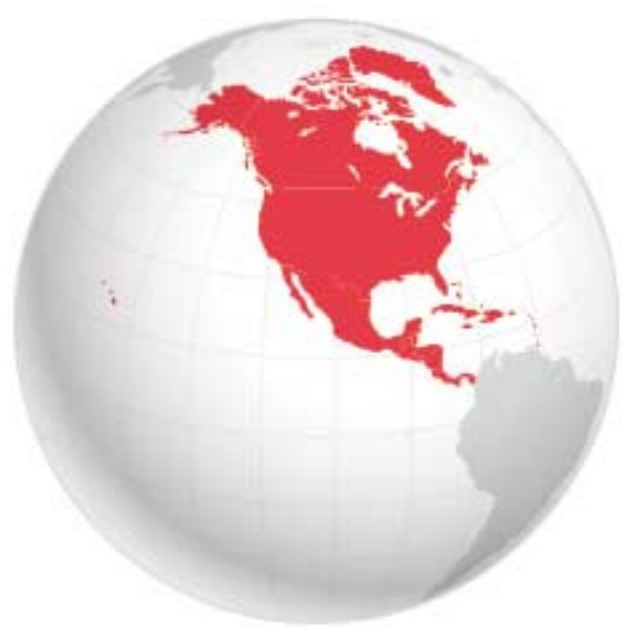
North America Amérique du Nord