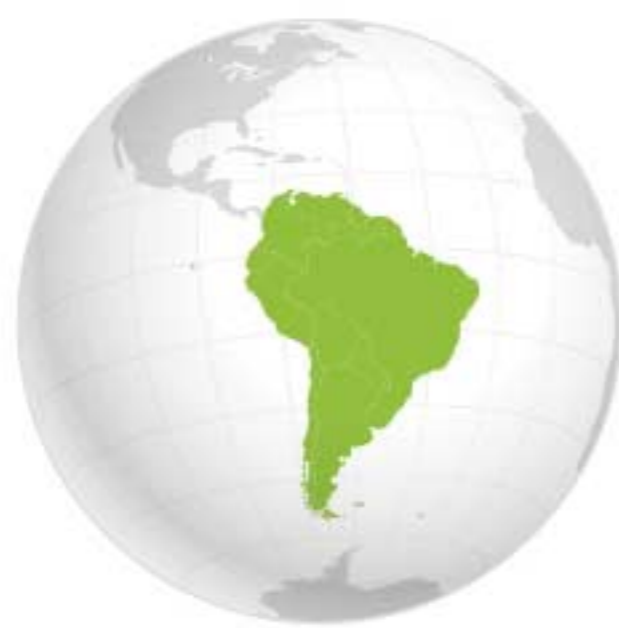
South America Amérique du Sud